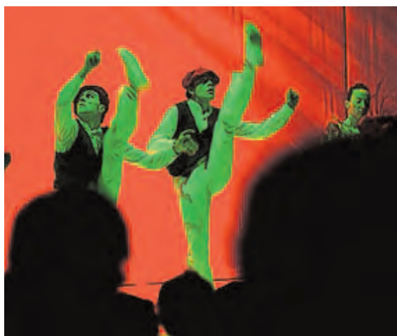
Danzaris estrenan el nuevo escenario.