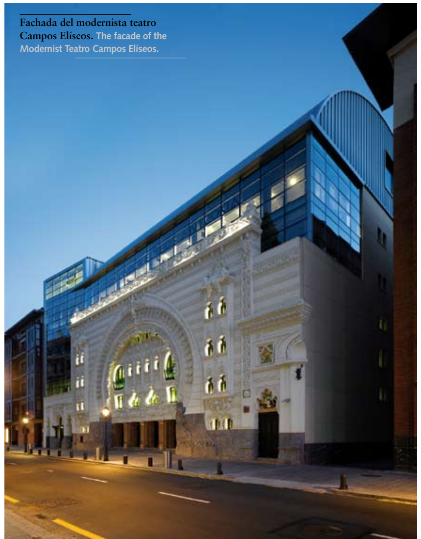
Fachada del modernista teatro Campos Elíseos. The facade of the Modernist Teatro Campos Elíseos.

This lover of aesthetics who identifies with the humanist architects —“capable of understanding the generality of the whole”— began his fruitful career by designing well-known residential projects in Madrid and other Spanish cities.